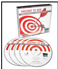
PRESENT TO WIN Perfekt Präsentieren in Business und Verkauf (ISBN 978-3-905357-70-7) – Hörbuch