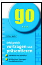
Erfolgreich Vortragen und Präsentieren (ISBN 3-453-68004-9)