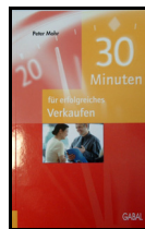
30 Minuten für Erfolgreiches Verkaufen (ISBN 3-89749-224-5)