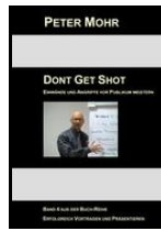
DONT GET SHOT Fragen, Einwände und Angriffe vor Publikum souverän meistern (ISBN 978-3-8423-2537-1)